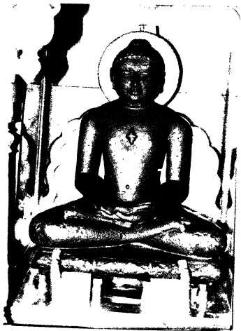
१०००८ भगवान श्रीमहावीर स्वामी जी